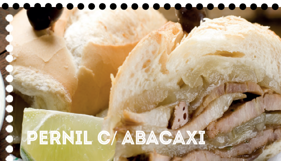
PERNIL C/ ABACAXI