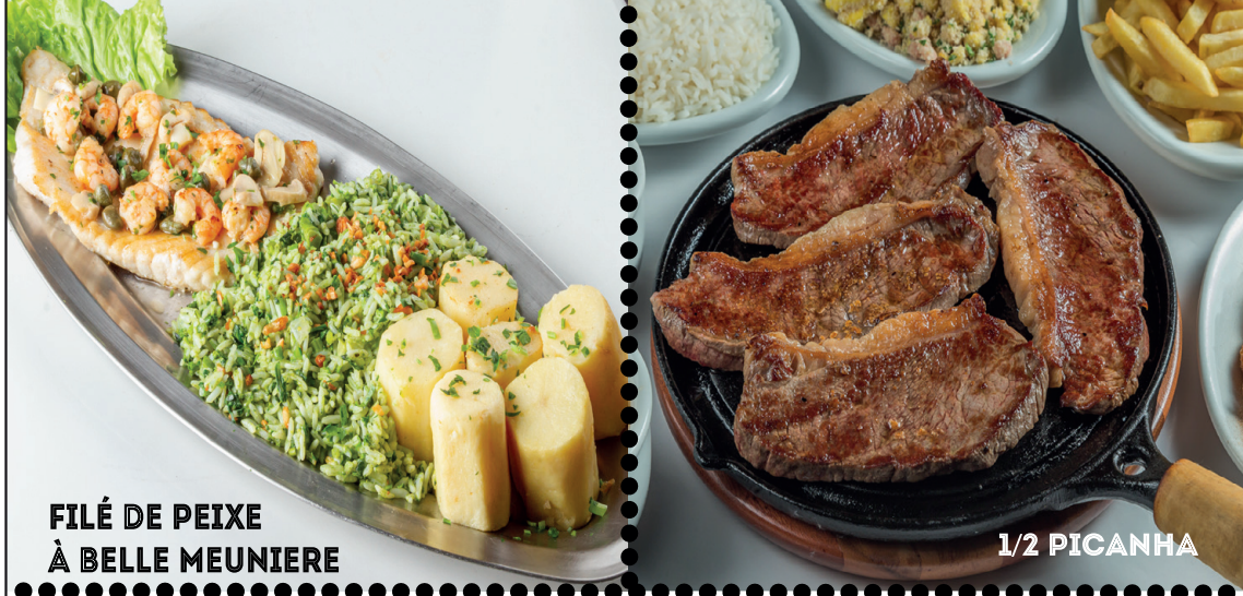
FILÉ DE PEIXE À BELLE MEUNIERE