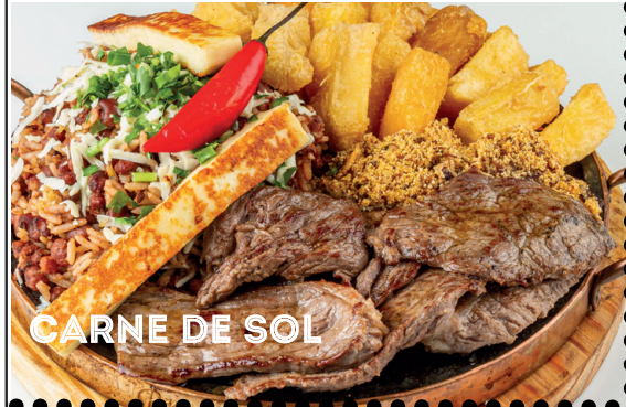
CARNE DE SOL