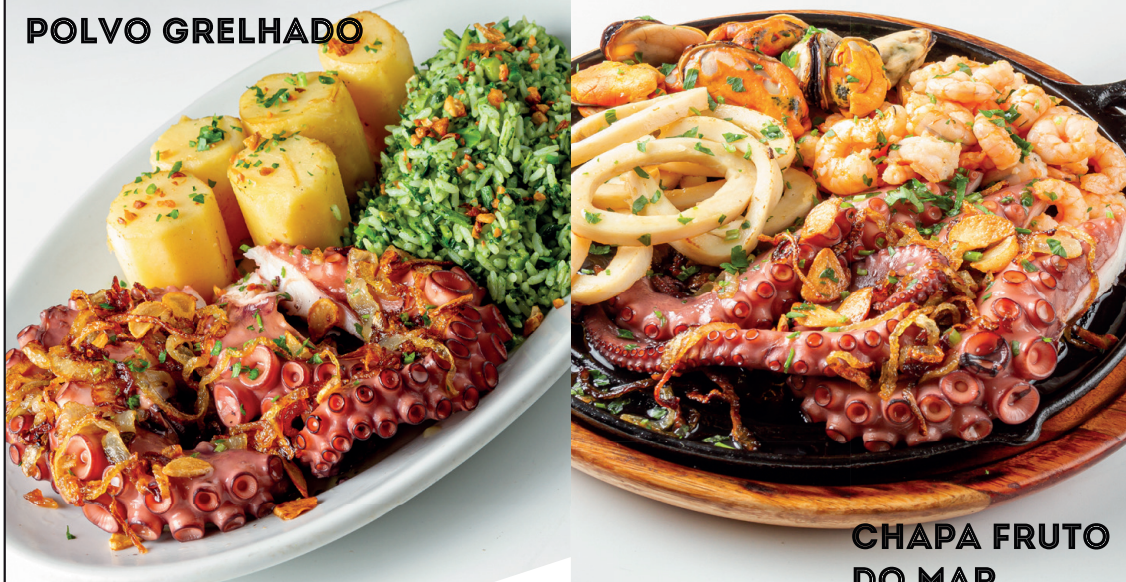
CHAPA FRUTO DO MAR