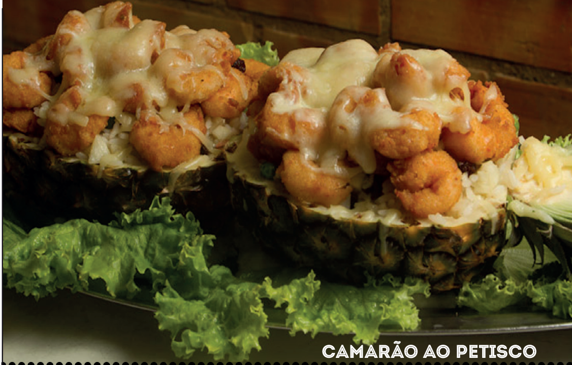
CAMARÃO AO PETISCO