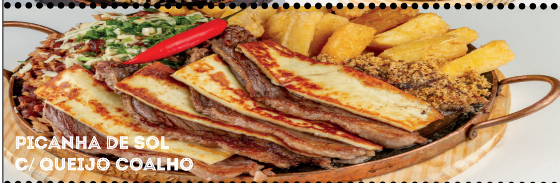
PICANHA DE SOL C/ QUEIJO COALHO